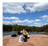
フィンランド ある夏の風景