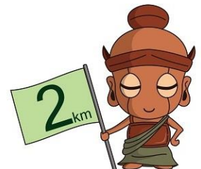
広瀬川沿い マラソンマーカー