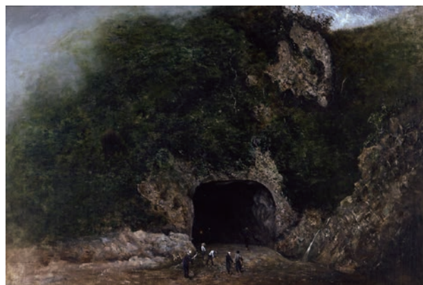
高橋由一《栗子山隧道図》1881年 宮内庁三の丸尚蔵館蔵