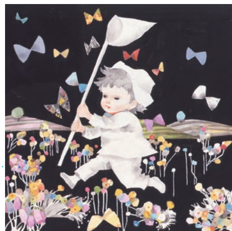
瓶文字《ピップとちようちよう》1956年 宮城県美術館蔵