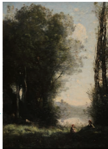
ジャン＝バティスト・カミーユ・コロロ《湖畔の木々の下のふたりの姉妹》 1865-70年 油彩/カンヴァス Inv.887.3.82 ランス美術館蔵