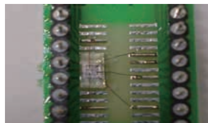
試作した臭化タリウム(TlBr)検出器