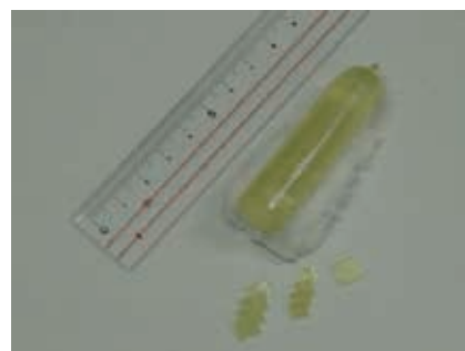
臭化タリウム臭化タリウム(TlBr)半導体結晶

研究ベースの成果を現実につなげるためには、基礎技術を積み重ねて実用化を成し遂げてきた民間企業の支援が不可欠であり、各専門分野の強みを活かした連携によって生み出される効果が期待される。