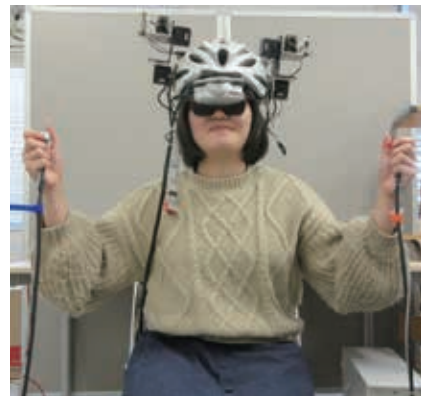
図1 バーチャルカメレオン

また、バーチャルカメレオンユーザの能力評価の基礎実験を行ったところ、ユーザ毎に成績が大きく異なっていました。そのため、ある種の能力評価に利用できるのでは無いかと考えています。