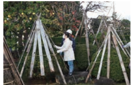
庭を守る伝統的な雪囲い