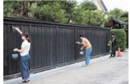
黒板塀の修理(柿渋塗装)

さらに、活用という視点では現在、文化財的価値のアピールだけでなく、まちづくりや観光、健康など広範囲な効果が求められています。地域まちづくり団体や異分野との連携を広げ、歴史ある建物の多様な活用の意義を考えていきたいと思っています。