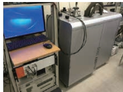
低温・強磁場環境でのデバイス評価装置

長期的視点からは、次世代の情報処理として有力視される量子情報処理への貢献を目的として研究を推進しています。短期的には、高感度な電荷検出器やテラヘルツ帯の電磁波の高感度検出などへの応用が期待されます。その他、デバイス作製に必要な電子線蒸着装置やスパッタ装置、ワイヤーボンダーによる配線、低温・強磁場環境でのデバイスの特性評価などでの協力が可能です。