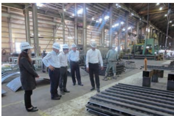
松本鐵工所における企業調査

これまでの実証的研究では、2017年度に北海道苫小牧地域における中小企業の管理会計手法の導入実態調査を実施してきました。東北地域においても、中小企業に関する実態調査を通じて各地域における地域資源の掘り起こしを行い、地域・産学連携において、地域産業の「つなぎ手」としての役割を果たしたいと思っています。会計学の観点から、地域の伝統を受け継ぐ若者の起業を支援し、中小企業の経営基盤を安定化させる貢献を目指しています。