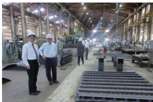
松本鐵工所における企業調査(左端:本人)