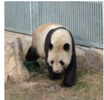
図2 電子透かしを埋め込んだ画像

また、本研究は、デジタルカメラの他にスマートフォンやタブレットで撮影した画像にも応用可能である。そのため、携帯端末向けアプリケーションを開発している企業との連携をしたいと考えている。本研究が印刷物に対応できるようになれば、パンフレットや写真集などに電子透かしを埋め込むことができるため、地域の商業活動にも応用できる。