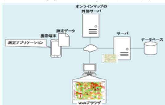
無線 LAN 利用可能エリア可視化システム

無線 LAN はスマートフォンなどの携帯端末をネットワークに接続する手段の一つであり、端末での配線が必要ないため広く普及が進んでいる。電波を用いているため、目に見える有線接続とことなり、実際に接続し利用できる範囲を把握することが難しい。そこで、実際に携帯端末で受信電波を測定し、オンライン地図上に利用可能エリアを図示する「無線 LAN 利用可能エリア可視化システム」の研究・開発を行っている。