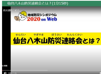
「防災シンポジウム」オンライン開催