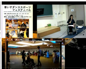
車いすダンス協会によるオンライン授業