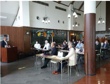
農業の六次化に向けたセミナー

2019年から西和賀町北部活性化推進委員会の依頼により「岩手県西和賀町北部地区住民と西和賀町の協働による地域づくり推進事業」を実施する。2020年度は、セミナーや他地域見学研修、ワークショップなどを実施し、それを基に地域づくりの具現化をする予定であったが、新型コロナウイルス感染症拡大の影響で県境を越えた活動は困難であり、実施した農業の六次化に向けたセミナーと地域交流会、仙台市秋保地区見学研修会も内容や人数は限られたものとなった。2021年度の事業計画を進めている。