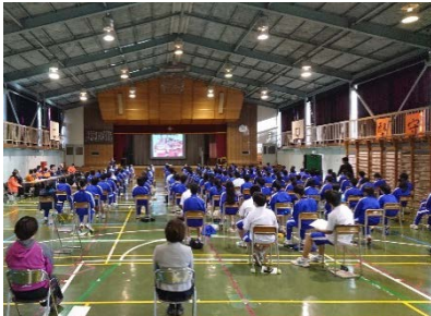
中学校での防災授業