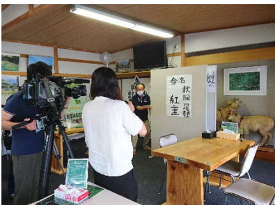
新種の桜「秋保足軽紅重」の命名

主体的な住民組織「野尻いぐする会」(2016年10月設立)の都市間交流事業を身の丈に合った持続可能な活動となるよう、秋保総合支所や本研究所などとの協働で取り組む。2020年度はコロナ禍のため、川遊び体験、そばまつりなどのイベントは中止したが、1回/2週の定例打ち合わせを行い、「野尻交流カフェ ばんどころ」運営や今後の会の運営に向けた意見交換、学生は組織づくりに関する研究をまとめた。