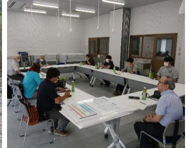
雄勝いしのわ会議