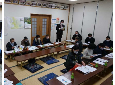
公民館での意見交換