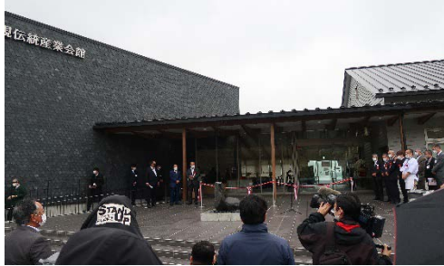
雄勝硯伝統産業会館 開所式

2020年5月に雄勝硯伝統産業会館がオープンした。7月から雄勝石産業の持続的主体的な運営や今後の雄勝石産業を中心とした地域づくりなどを課題とし、雄勝硯生産販売協同組合との「雄勝いしのわ会議」を開始した。この組合が「令和2年度伝統的工芸品産業振興費補助金【品質表示,知名度向上事業】」を獲得したため、オンラインでの定例会議や補助金実行委員会、勉強会など行った。