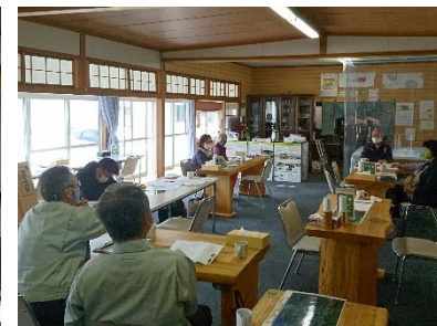
野尻いぐする会の定例会議