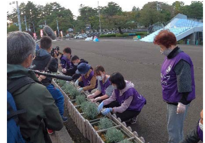
ハーブまちづくり活動の東北放送の取材