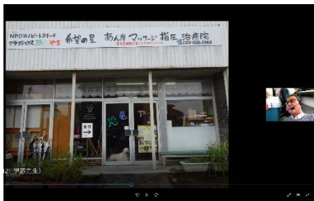
安藤氏との市民公開講座