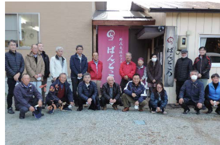
仙台市秋保地区見学研修会