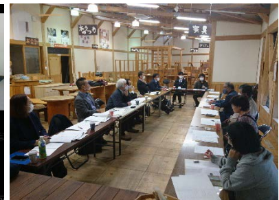
道の駅津山復興活性化事業打ち合わせ