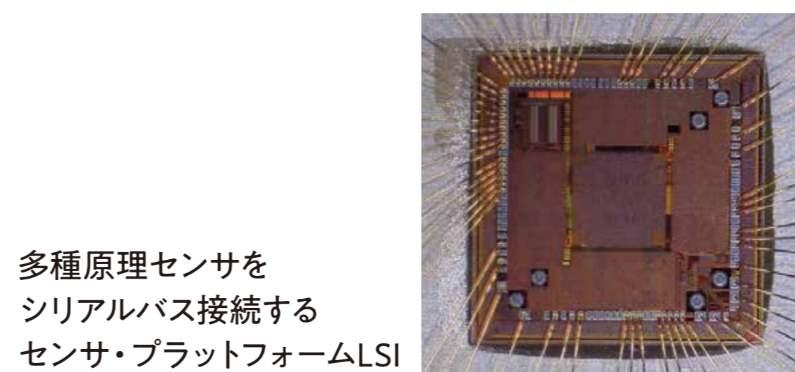
多種原理センサをシリアルバス接続するセンサ・プラットフォームLSI