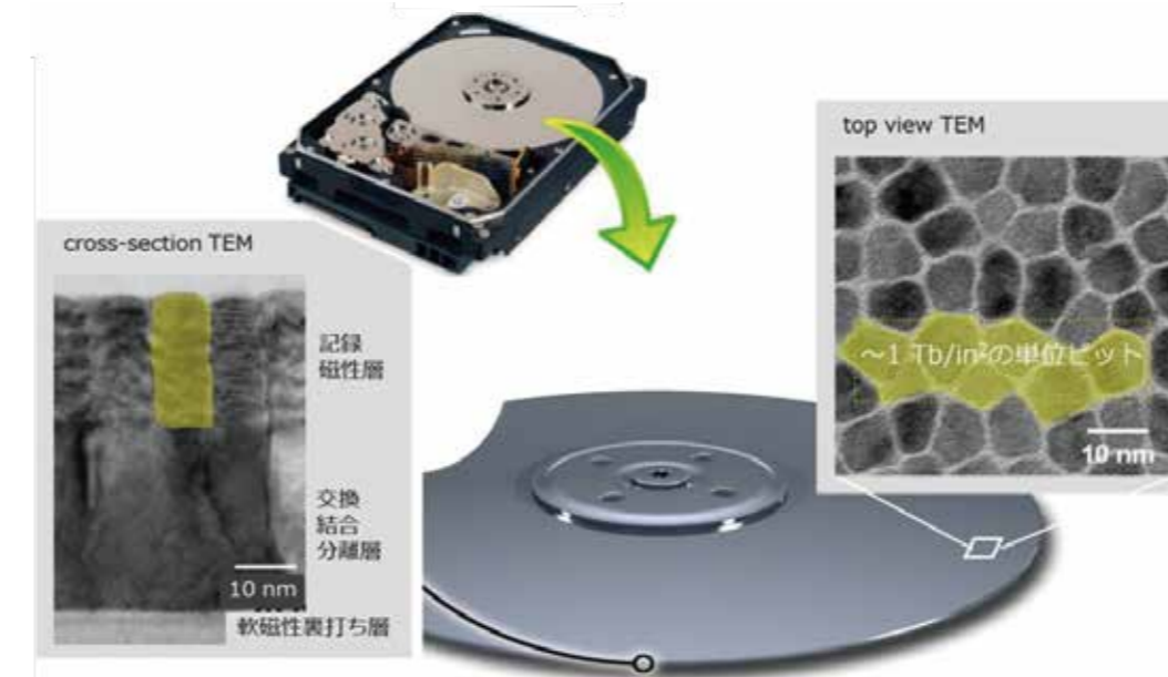
データセンターで使われるHDDとその内部構造