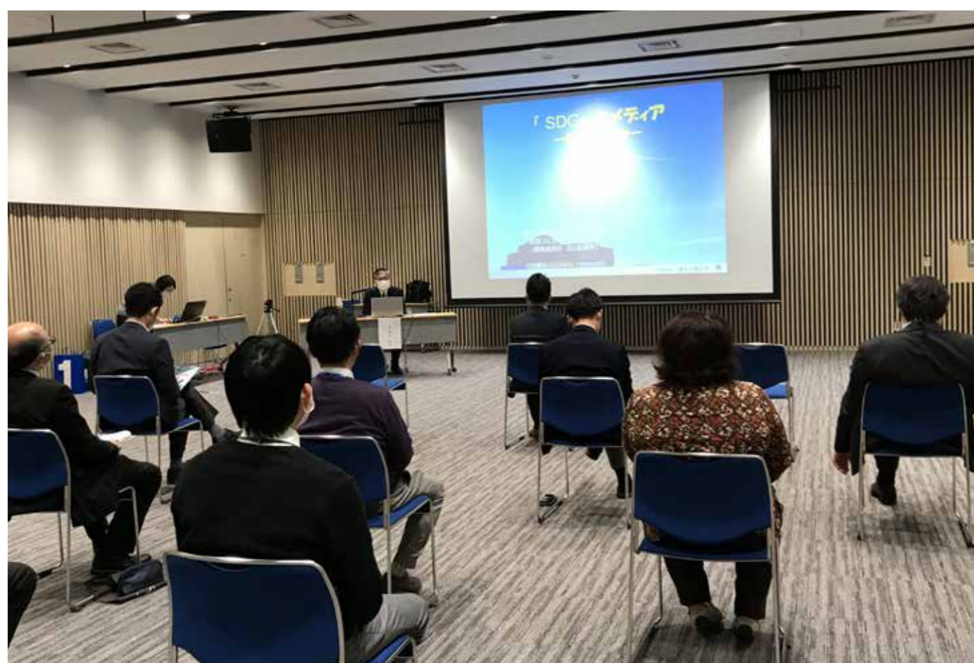
小祝先生による東北放送での講演会「SDGsとメディア」