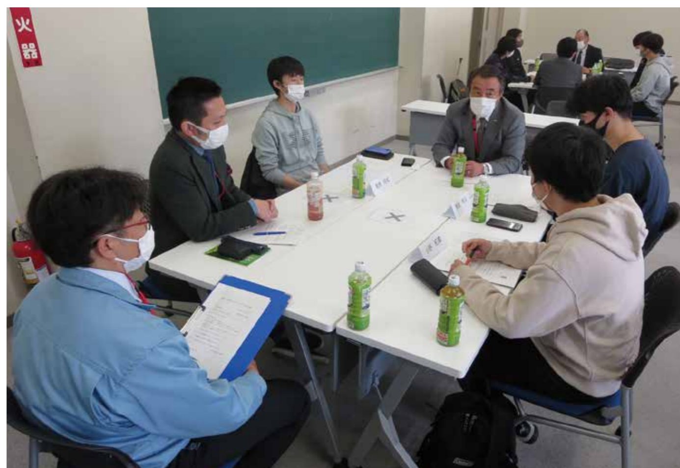
宮城県中小企業家同友会の経営者との意見交換会