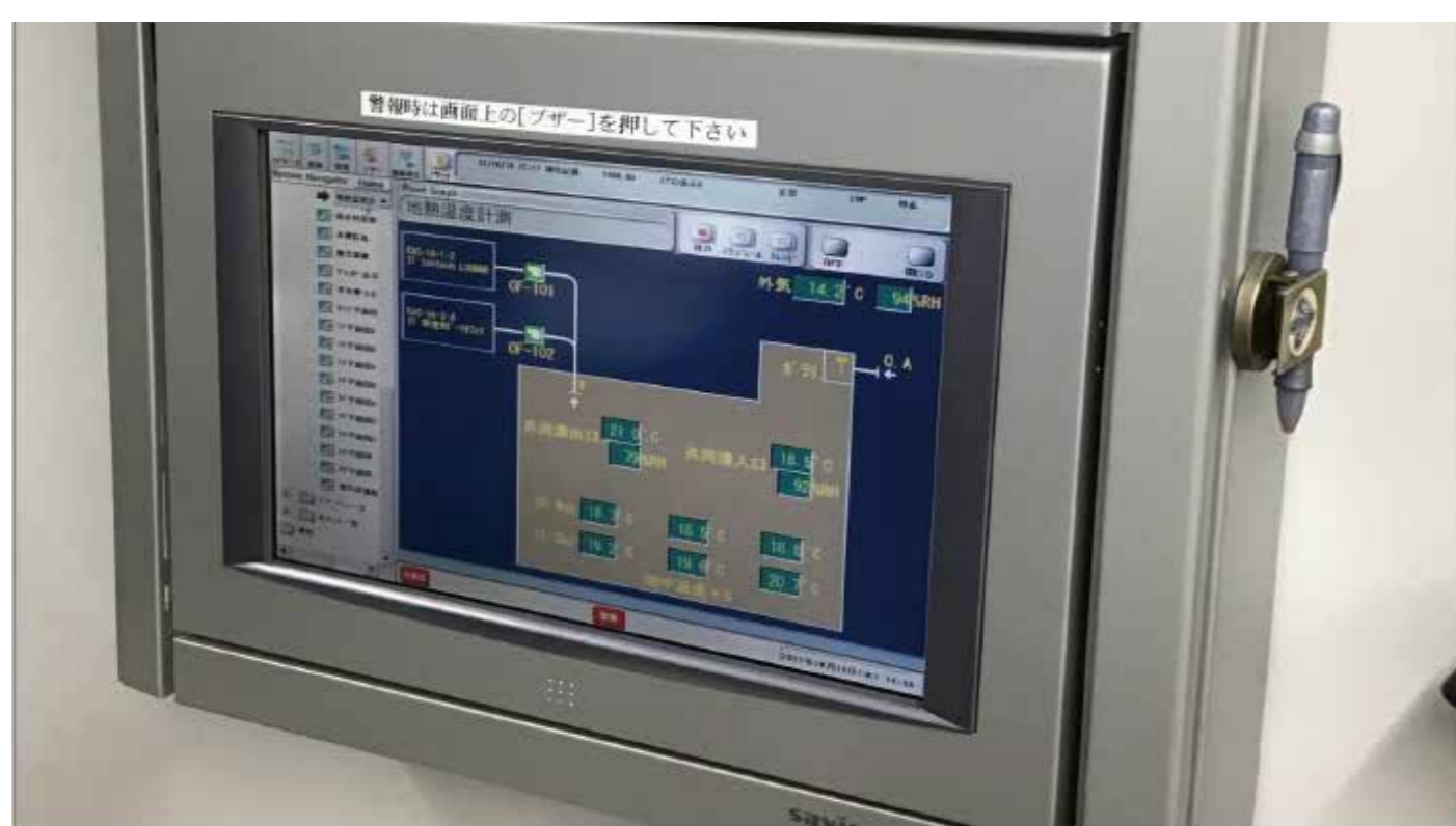
大学建物の中央監視装置