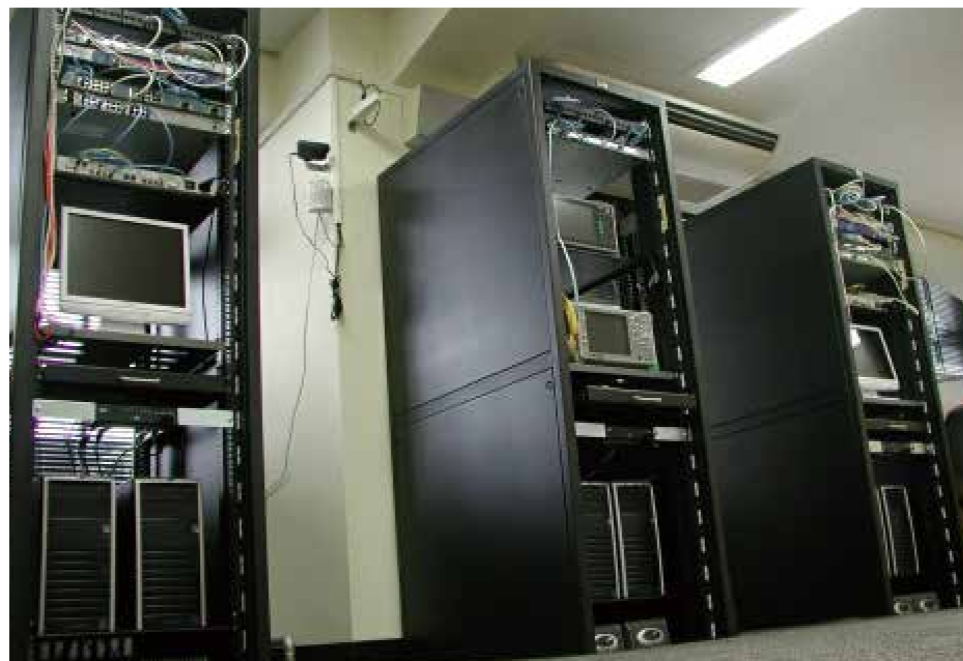
実環境に近い構成での実験が可能な基幹ネットワーク装置