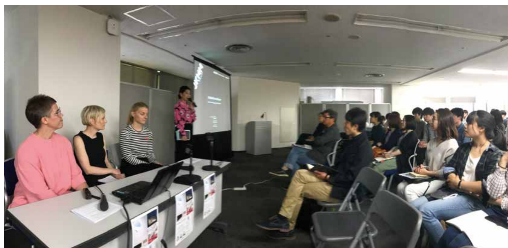
フィンランドの建築家を招いての講演会開催(2019/5)の様子