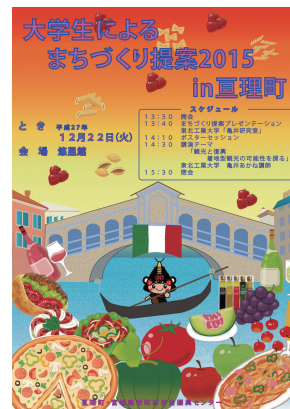
図2：大学生によるまちづくり計画平成27年12月22日発表