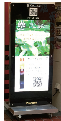
図3：デジタルサイネージ平成27年度制作