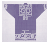
◀木綿衣▶ 日本民芸館蔵

アイヌの工芸品は、明治・大正期までは民族工芸としてしか扱われていませんでした。昭和期に入り民芸運動の中心人物・柳宗悦と芹沢銈介によって、アイヌの独創的な工芸品は芸術の域まで高められ、広く紹介されることになります。本講座では、その歩みをたどるとともに、アイヌの美意識を読み解きます。