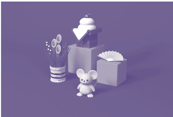
新年おめでとうございます！2020年もどうぞよろしくお願いたします！ (Design: 東北工業大学 クリエイティブデザイン学科3年生 佐々木歩果)