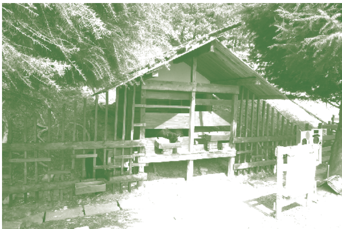
長町キャンパスにあるヤギ小屋がリニューアル! さて黒ヤギ2匹はどこにいるでしょう?