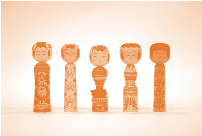
「みやぎの伝統こけし」(10/26～10/31 第1回みやぎ伝統工芸士逸品展より)

開館時間／10:00～19:00(最終日は18:00まで) ※入場／無料 休 館 日／木曜日