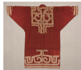
《木綿衣》日本民芸館蔵

アイヌの工芸品は、明治・大正期までは民族工芸としてしか扱われていませんでした。昭和期に入り民芸運動の中心人物・柳宗悦と芹沢銈介によって、アイヌの独創的な工芸品は芸術の域まで高められ、広く紹介されることとなります。本講座では、その歩みをたどるとともに、アイヌの美意識を読み解きます。