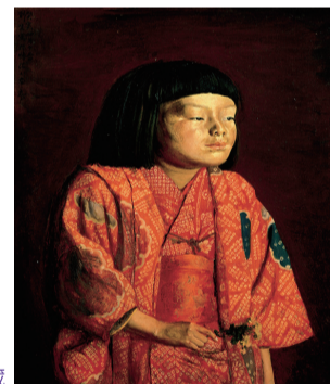
岸田劉生<<童女図(麗子立像)>>1923年 神奈川県立近代美術館蔵

1915年に草土社を結成し、《切通之写生》や麗子像の連作を発表した岸田劉生(1891~1929)。その「内なる美」を深く追求した写実表現は、若き画家たちに影響を与え、当時の画壇に一石を投じました。米沢生まれの椿貞雄(1896~1957)は19歳で草土社の創立同人となり、劉生が鶴沼に転居すると、自身も移り住んで行動をとるなど、とりわけ劉生の身近で、影響を受けたひとりです。二人の絵画への情熱と友情と、その芸術を紹介します。